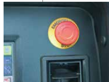
▲エンジン緊急停止ボタン(クレーン作業時のみ機能)