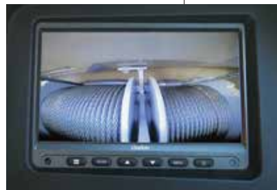
▲カラーディスプレイ(4画面表示可能)

※写真は、機能説明のために各ランプを点灯したものです。実際の走行作業状態を示すものではありません。