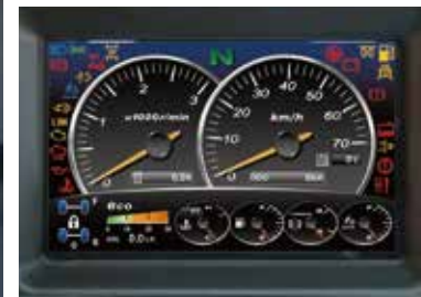
(クレーン操作モード)

※写真は、機能説明のために各ランプを点灯したものです。実際の走行作業状態を示すものではありません。